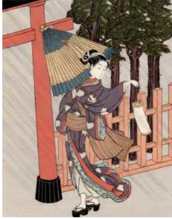
(가) 스즈키 하루노부