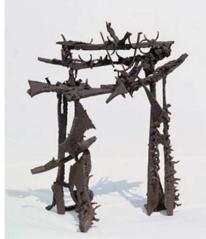
(나) 김종영, <전설>, 1958