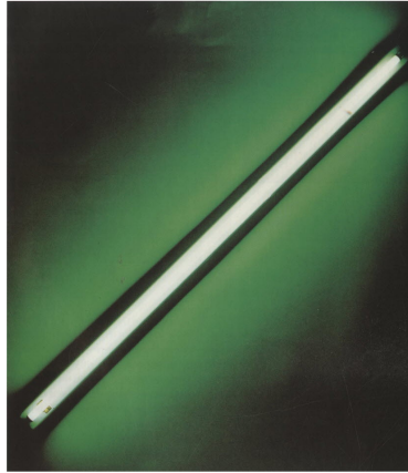
(가) 댄 플레빈