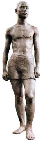
(가) 김복진, <소년>, 1940