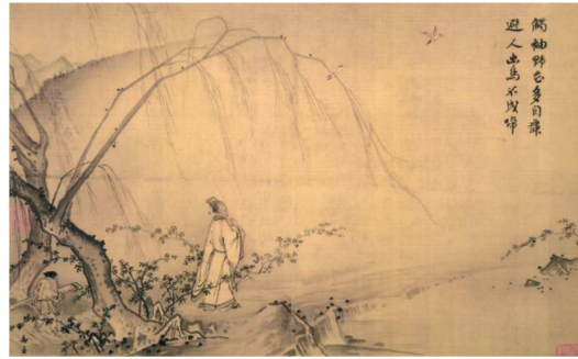
(나) 마원, <산경춘행도>