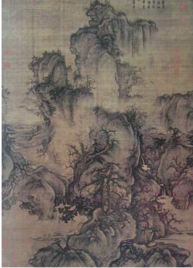
(가) 곽희, <조춘도>